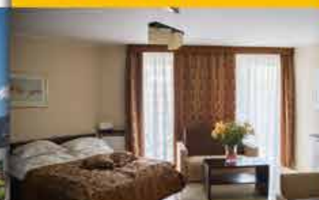
Zimmerbeispiel, 3★ Hotel Avangard Resort