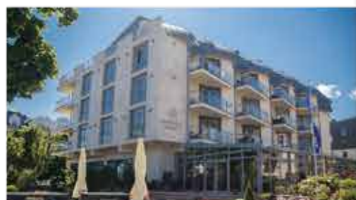
3★ Hotel Avangard Resort