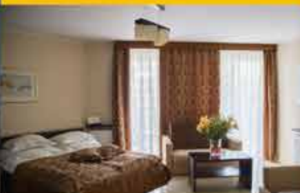
Zimmerbeispiel, 3* Hotel Avangard Resort