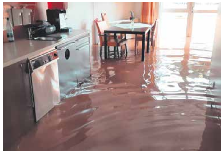
Überfluteter Gemeinschaftsraum mit Küche in der Anlage Erftstadt.

Das SoVD-Spendenkonto lautet: IBAN: DE82 5206 0410 1003 9999 39; BIC: GENODEF1EK1, Evangelische Bank (EB). mv